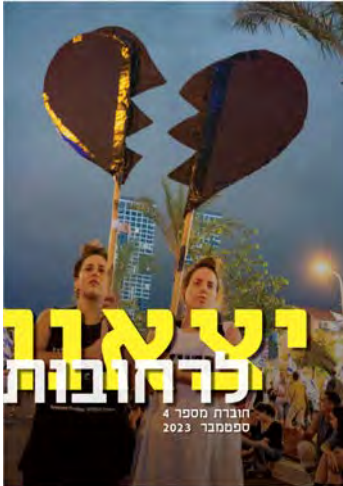
יצאנו לרחובות #4