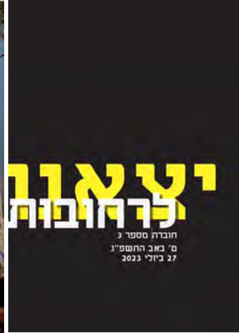
יצאנו לרחובות #3