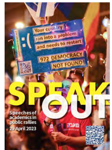
Speak Out #1