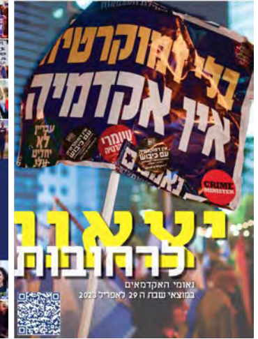
יצאנו לרחובות #1