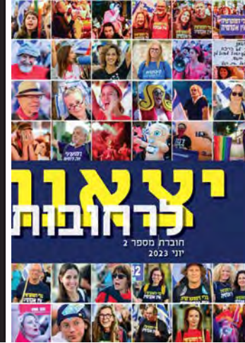
יצאנו לרחובות #2