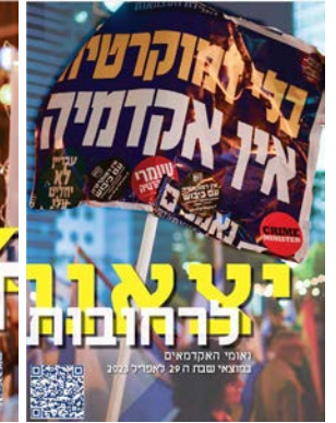
יצאנו לרחובות #1

נשמח לקבל חומרים חדשים לחברות הבאות, נאומים, דעות, שירים, ציורים ותצלומים דואל למשלוח: matehaacademia@gmail.com