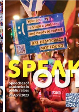
Speak Out #1