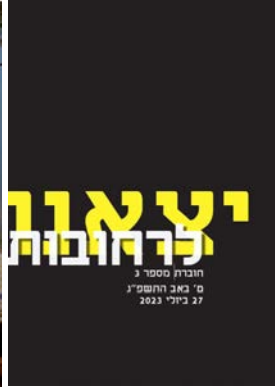
יצאנו לרחובות #3