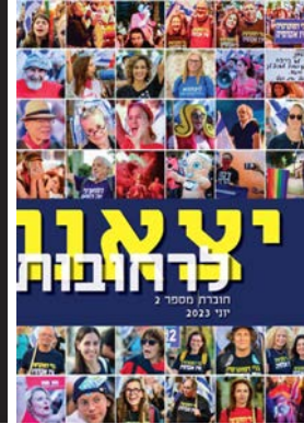
יצאנו לרחובות #2