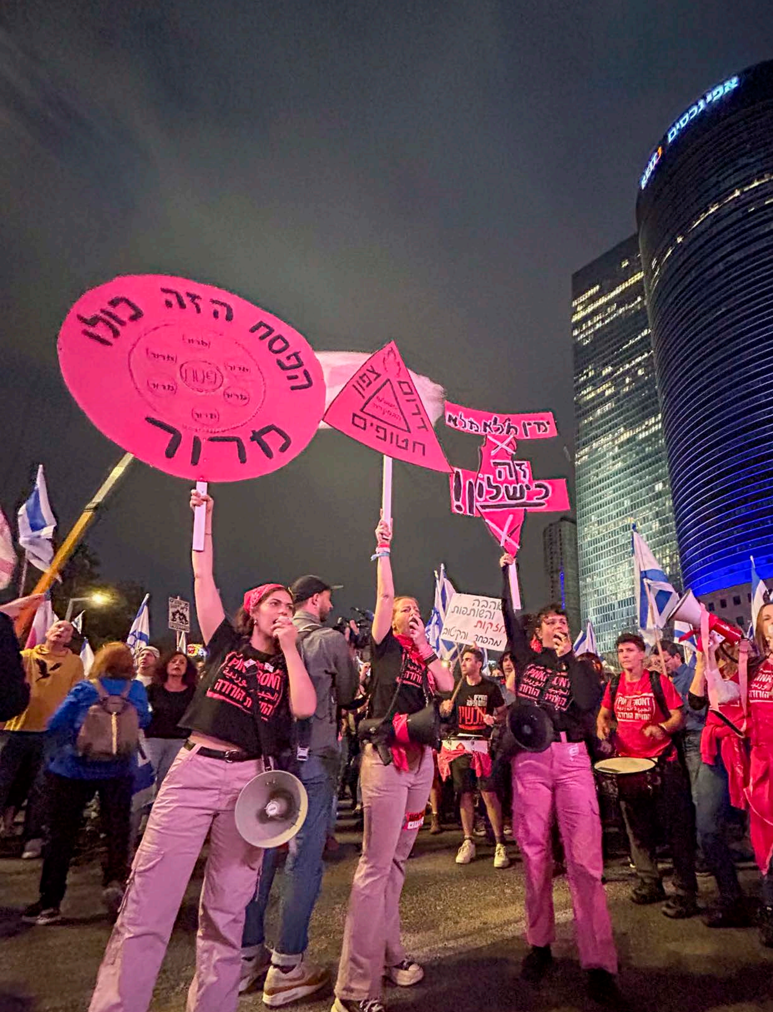
מטה המאבק - אקדמיה מאי 2024