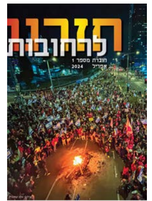
חזרנו לרחובות #1

צוות העורכים אלון קורנגרין, דורון כהן ורונית ספר-כהן