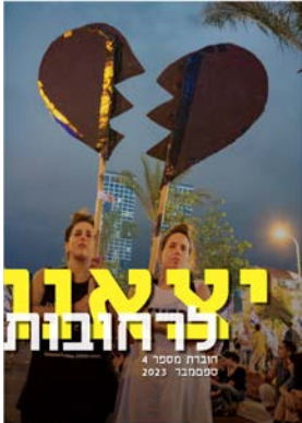
יצאנו לרחובות #4