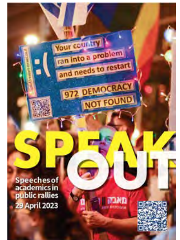
Speak Out #1