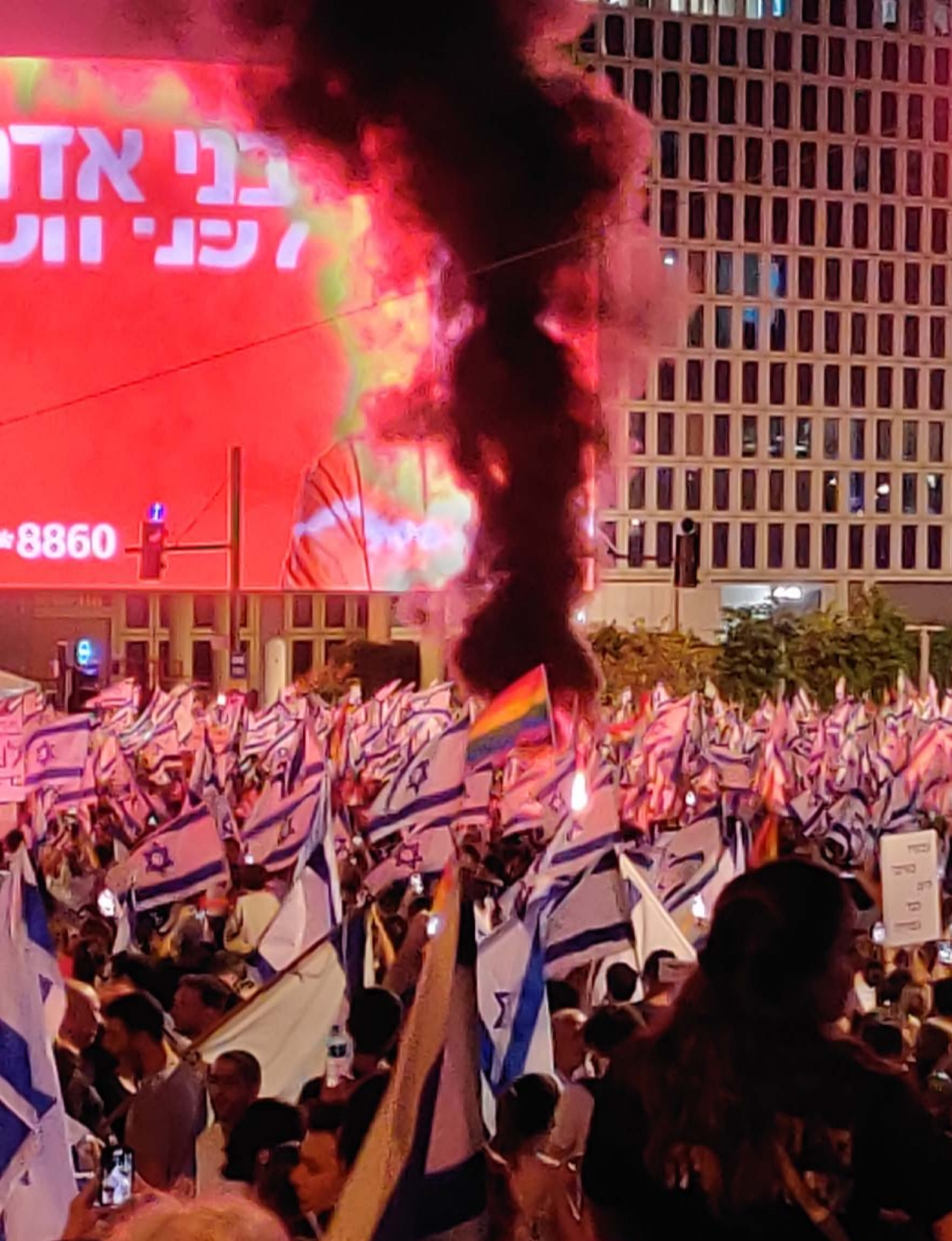
מטה המאבק - אקדמיה יולי 2023