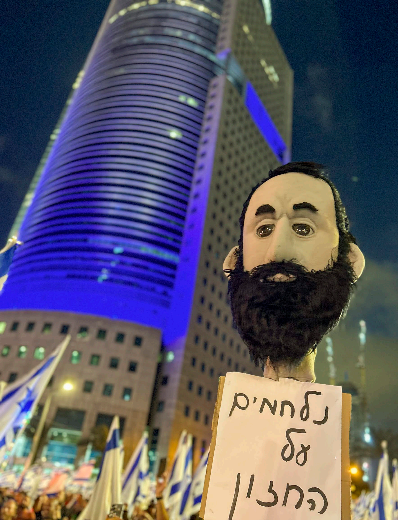
מטה המאבק - אקדמיה יוני 2023