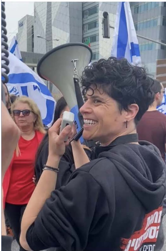
16 🗨️👍👎 6 shares